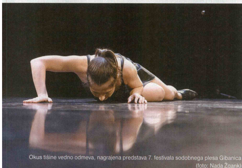
Okus tišine vedno odmeva, nagrajena predstava 7. festivala sodobnega plesa Gibanica