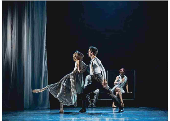
Veliki Gatsby , koreografija Leo Mujić, produkcija SNG Opera in balet Ljubljana