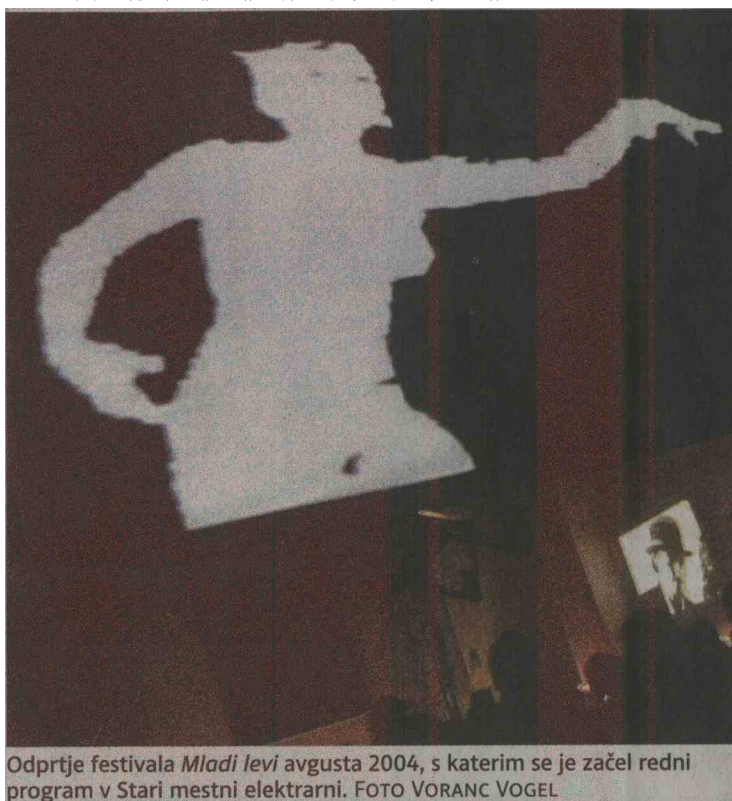
Odprtje festivala Mladi levi avgusta 2004, s katerim se je začel redni program v Stari mestni elektrarni.

V Stari mestni elektrarni se je doslej zgodila večina uprizoritvenih festivalov, poleg Mladih levov še Mesto žensk , Exodos in Ex Ponto . Upravitelj elektrarne, zavod Bunker, sodeluje z drugimi produkcijskimi hišami: Maska, Emanat, En-Knap, Muzeum, E.P.I Center, B-51, DUM, Fičo balet, Federacija, Aksioma, Galerija Kapelica idr. V prostorih vadijo različne skupine, potekajo izobraževalni programi (delavnice, classi , predavanja), ob večerih pa predstave ali multimedijski dogodki. Letno gosti od 100 do 150 dogodkov.